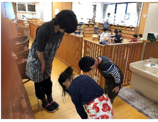
指導担当の先生にあいさつから