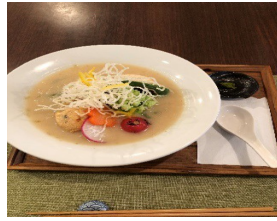
金粉の入ったスープ